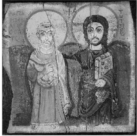
Ikone der Freundschaft, Taizé

Lieber Firmling, liebe Jugendlicher und alle Interessierte!