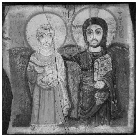
Ikone der Freundschaft, Taizé